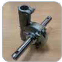
Transmisión de aluminio